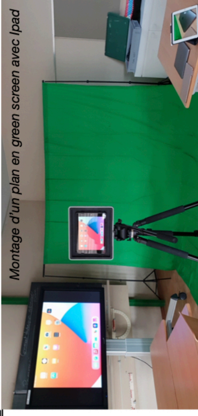
Montage d'un plan en green screen avec Ipad