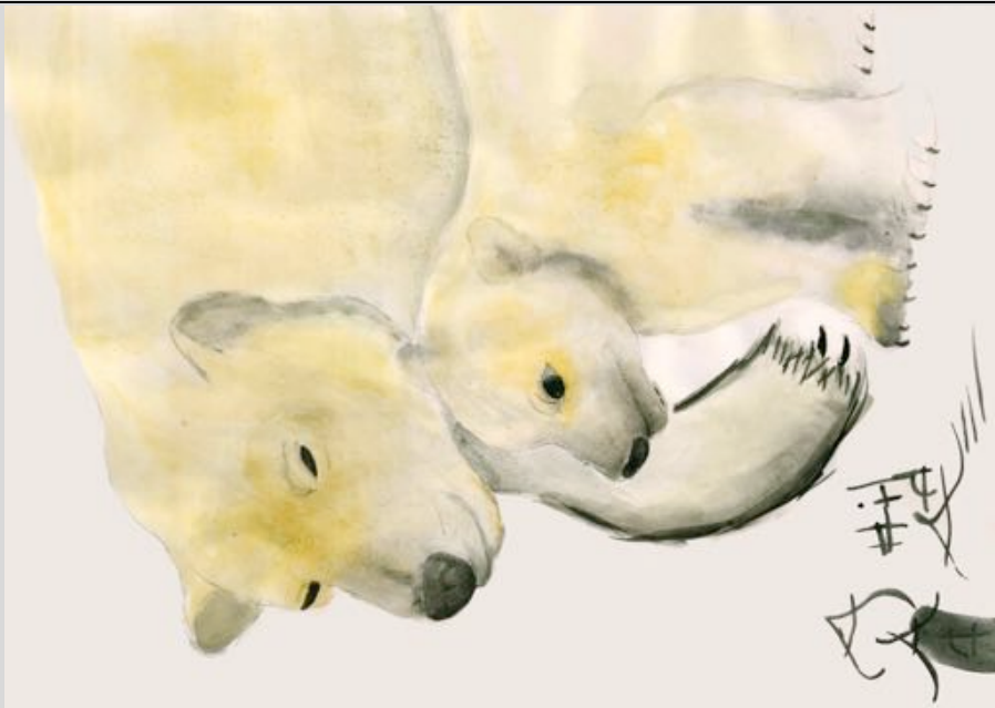
Carte établissement Concours remporté par la 10VG2