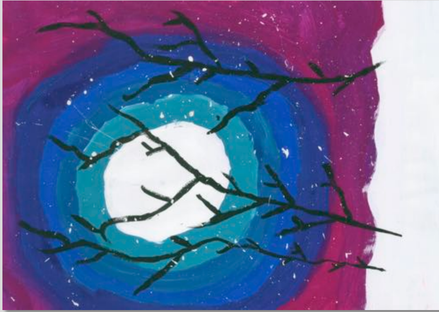
Carte école Concours remporté par la 4P/2